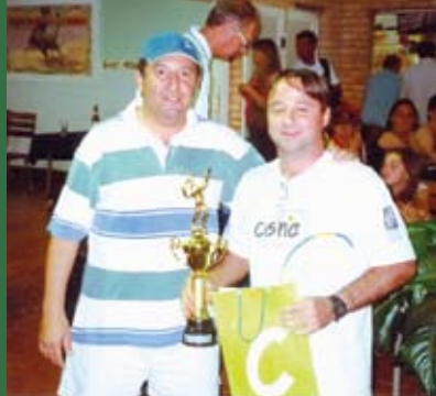
Torneio de Tênis 2007