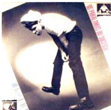
Os Paralamas do Sucesso – O passo do Lui (1984)

Também conhecida somente por Paralamas, essa banda faz parte do chamado quarteto sagrado do rock brasileiro , junto com o Barão Vermelho, Titãs e Legião Urbana. Apesar de serem considerados parte da Turma de Brasília , por terem vivido e criado amizade com as bandas locais, é uma banda formada no Rio de Janeiro no final dos anos 70. Seus integrantes desde 1983 são os mesmos, Herbert, Bi Ribeiro e João Barone. Em 1984 lançaram esse álbum – o melhor da banda – que teve enorme sequência de sucessos ( Óculos , Me liga , Meu erro , Romance ideal , Ska ) e aclamação crítica, levando o grupo a tocar no Rock in Rio .