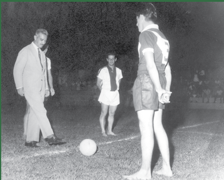
Inauguração da Praça de Esportes 1965