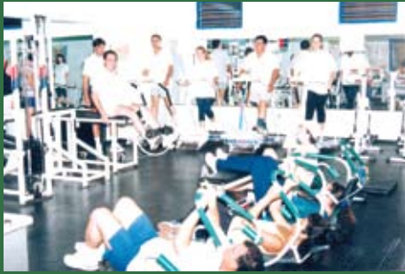
Qualidade de vida, esporte e lazer