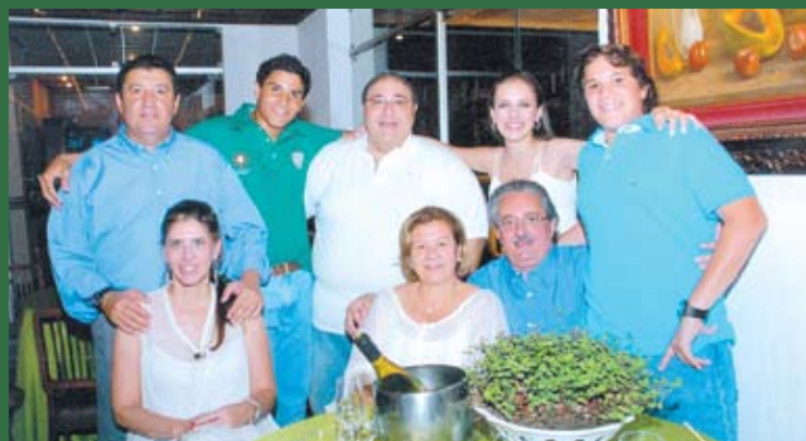
Presidente Hussein Gemha e família

indefinida que aquele prédio anos sessenta parecia reter e espalhar no ambiente, com móveis anos sessenta, quadros belíssimos, mobiliário fascinante, espelho de cristal. Pareciam prever que o local onde aconteciam os eventos sociais, políticos e culturais da cidade estava se transformando. Perdendo espaço para as banalidades, para a televisão. Mas tinham vivido um bom tempo.