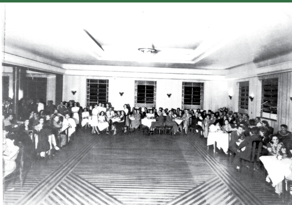
Grêmio da 18 Salão de Baile

E ste tipo de sentimento é que fez a marca do Grêmio durante os tempos. O charme, a elegância, a arte que o clube trazia consigo rompia com a simplicidade da