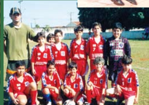
Escolinha de futebol

As grandes exposições de arte. O teatro com seus 250 lugares. O salão de festas, acolhendo aniversários, bodas, formaturas, acolhendo sonhos. A boa comida de todos os dias e as grandes e tão esperadas Noites Gastronômicas, com comidas típicas feitas por mãos experientes. “Nosso salão de festas tem lugar para 800 pessoas e o baile da velha guarda tem sido sucesso todo mês”, afirma Hussein.