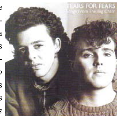
Tears for Fears – Songs From The Big Chair (1985)

Considerado o álbum de maior sucesso e obra máxima do grupo, esse disco viria a vender mais de 10 milhões de cópias, emplacando sucessos como Everybody Wants to Rule The World e Shout (ambas atingindo o 1º lugar nas paradas americanas) e Head Over Heels (3º lugar). O grupo sairia em turnê para só depois de quatro anos lançarem outro disco, mais pop ainda do que os anteriores, chamado Seeds of Love . O disco chama a atenção pela sofisticação dos arranjos e pelas letras cuidadosamente elaboradas. O título foi inspirado no livro Sybil que falava sobre uma garota com múltipla personalidade.