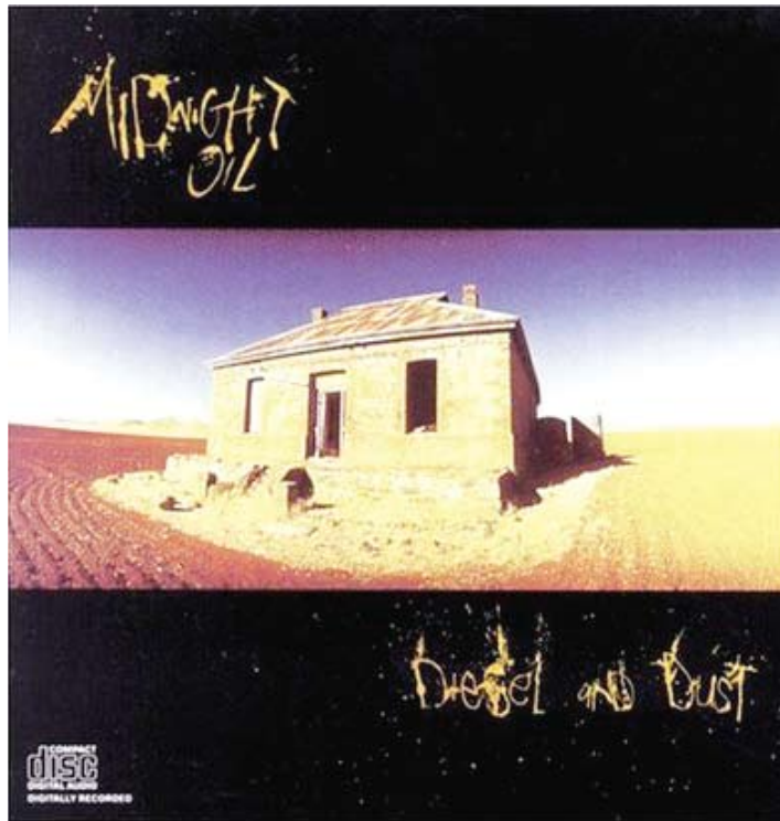
Midnight Oil – Diesel and Dust (1987)

Em 1987 o Midnight Oil atingiu o auge de seu sucesso com o lançamento desse álbum, que é considerado até os dias de hoje um dos maiores álbuns já lançados em toda a Austrália. Poderoso, dinâmico e revelador, músicas como Beds are Burning e The Dead Heart – hits que faziam encher a pista de dança da Boate do Grêmio nos final dos anos 80 – entre outras, foram instantaneamente convincentes para que eles fossem considerados a melhor banda de rock surgida na Austrália nos anos 80. A canção The Dead Heart (Coração Morto) foi composta a pedido dos Aborígenes australianos para celebrar a devolução de suas terras por parte do governo da Austrália após uma longa batalha judicial.