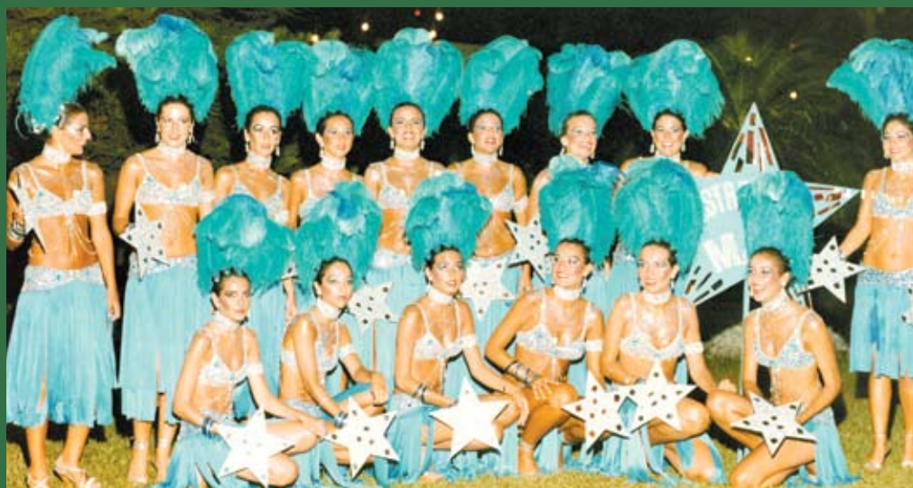
Bloco Estrêlas do Mar