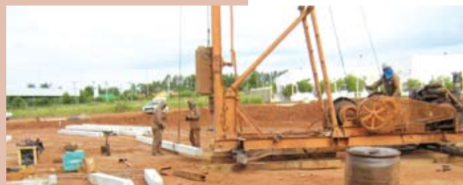
Terraplenagem e maquete da Faculdade